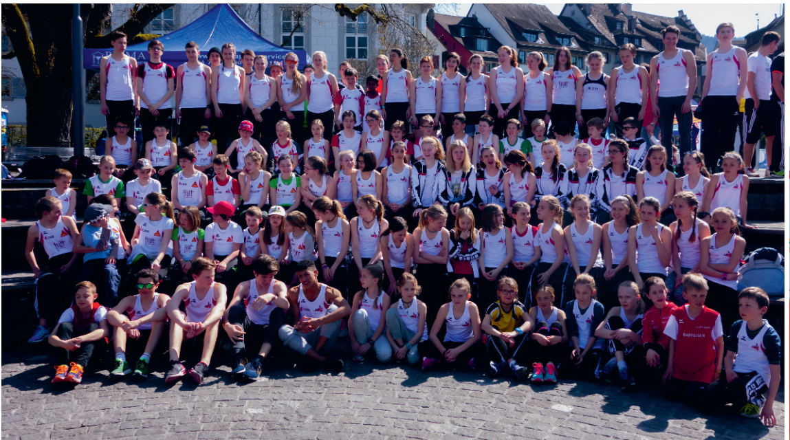
Foto: LG Unterwalden am Quer durch Zug 2017

Seit 2012 gehört die LA Nidwalden zusammen mit den Obwaldner Leichtathletikvereinen TV Sarnen, STV Alpnach, LA Kerns und LA Lungern zur LG Unterwalden. Die LG Unterwalden organisiert gemeinsame Teamwettkämpfe, Trainings und Meetings.