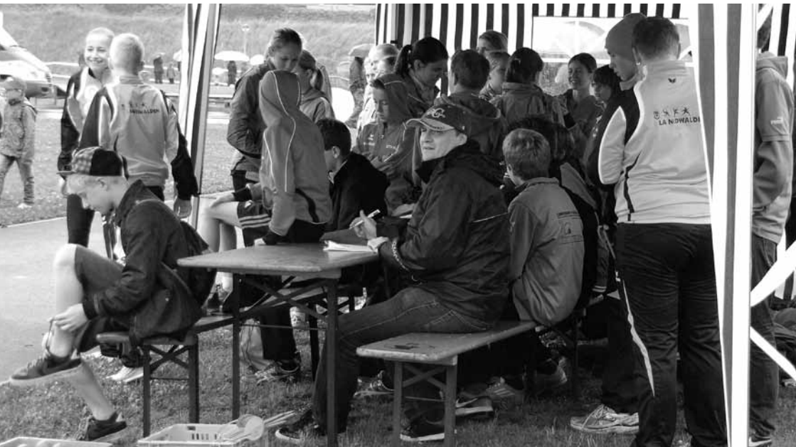
Grosser Andrang beim Ballwurf