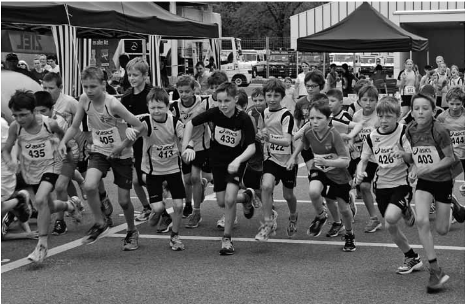
Start der Schüler B mit 37 Läufern