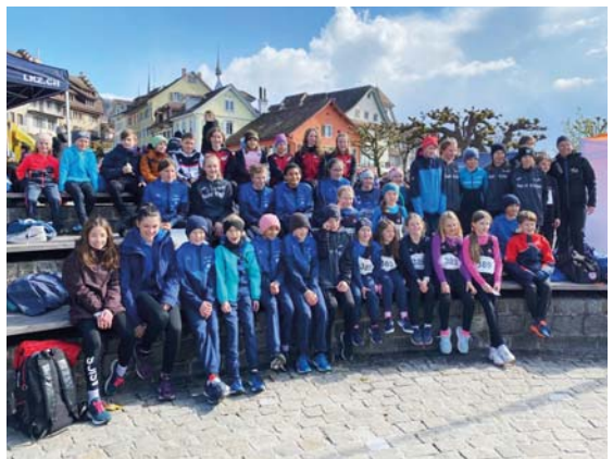
Gruppenfoto U10 bis U14