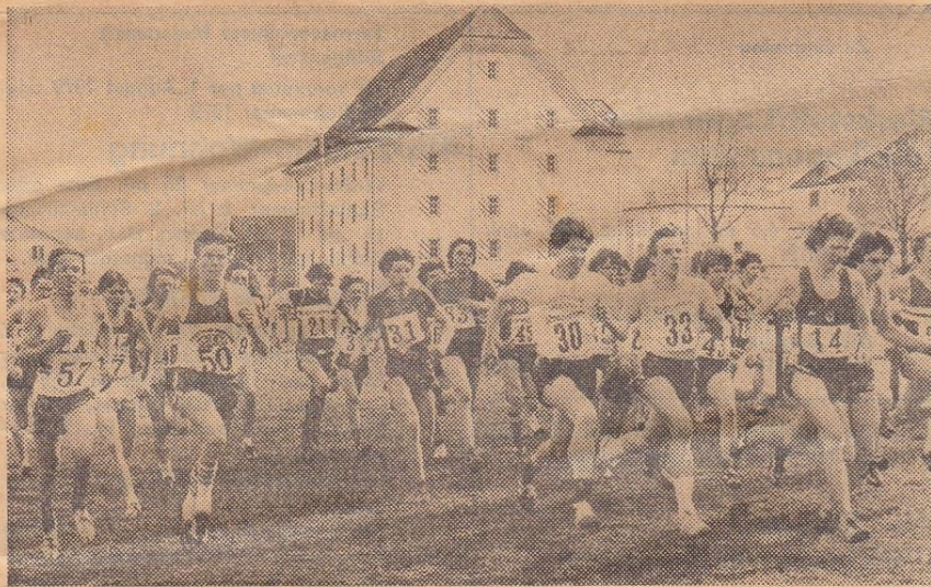
Ein kompaktes Feld am Start in Stans.