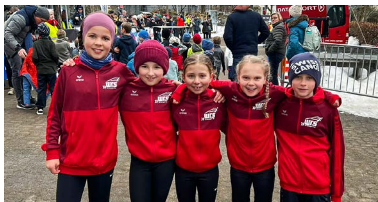
Die motivierte U12-Gruppe vor dem Start