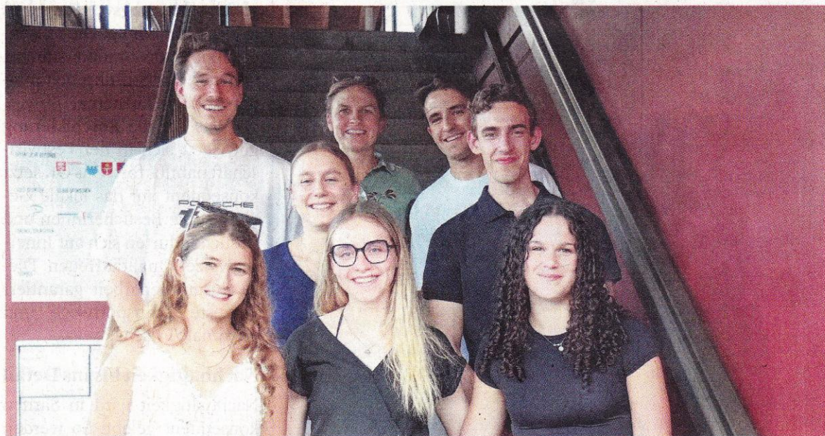
Die ausgezeichneten Nidwaldner Leichtathletinnen und -athleten beim Gönner-Anlass.